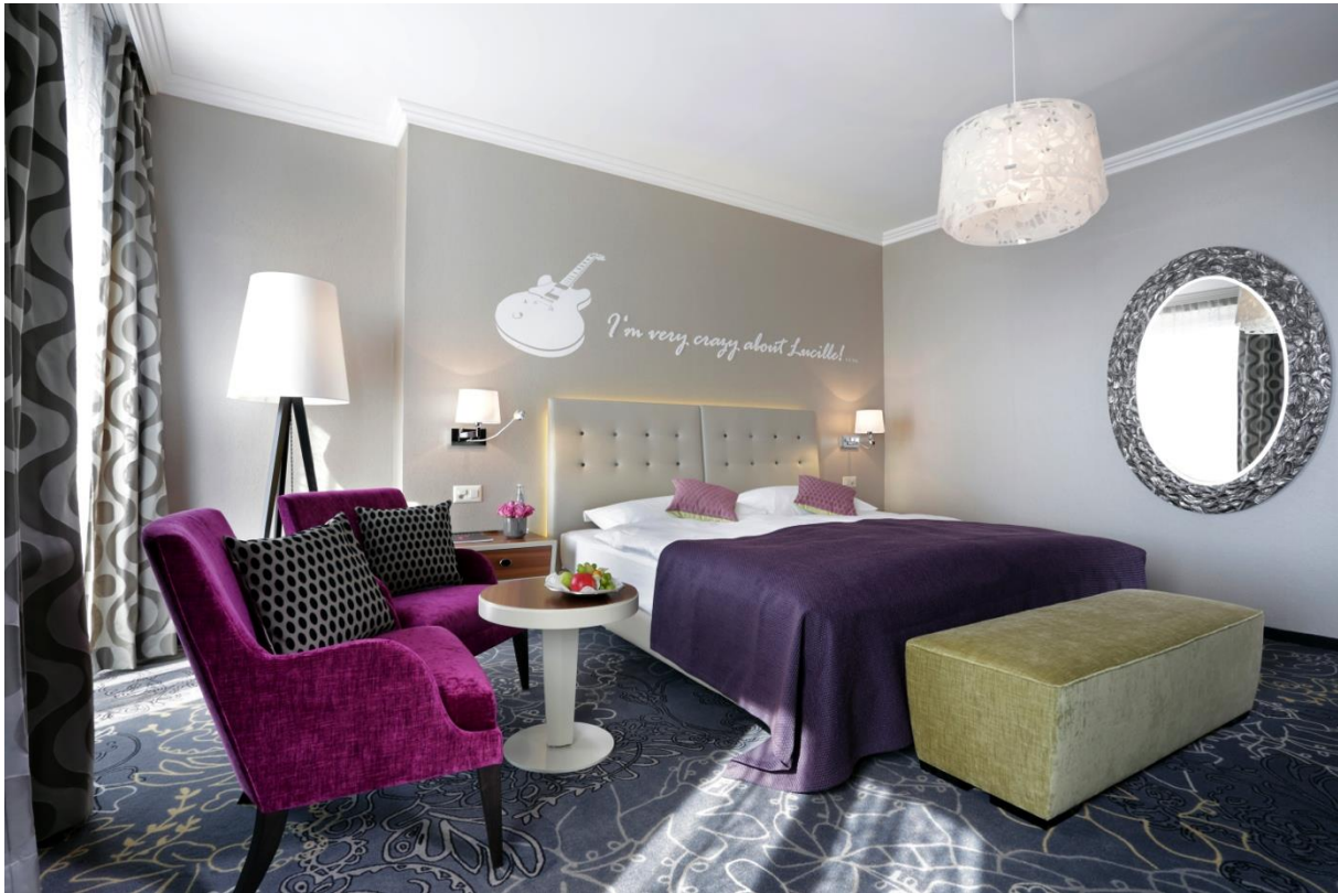
Preisgekröntes Deluxe Doppelzimmer