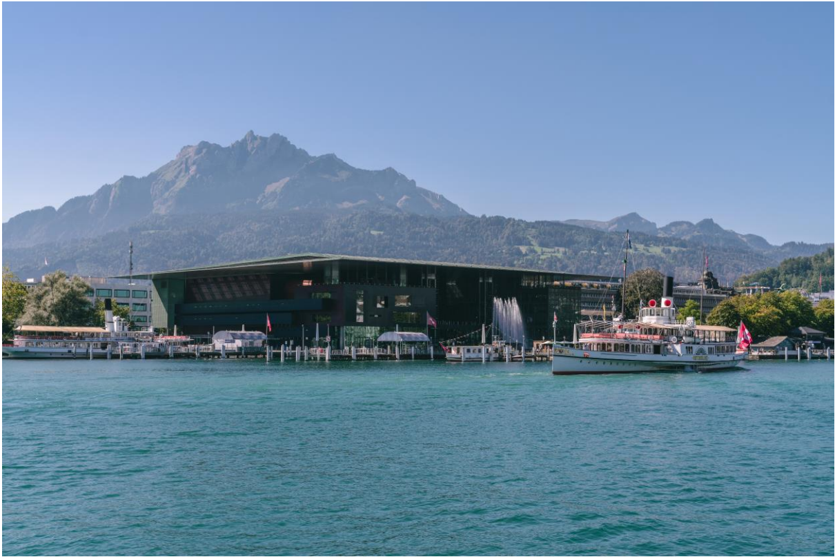
KKL Luzern mit dem Hausberg Pilatus