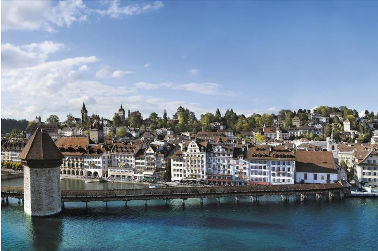
Die historische Kapellbrücke mit dem Wasserturm