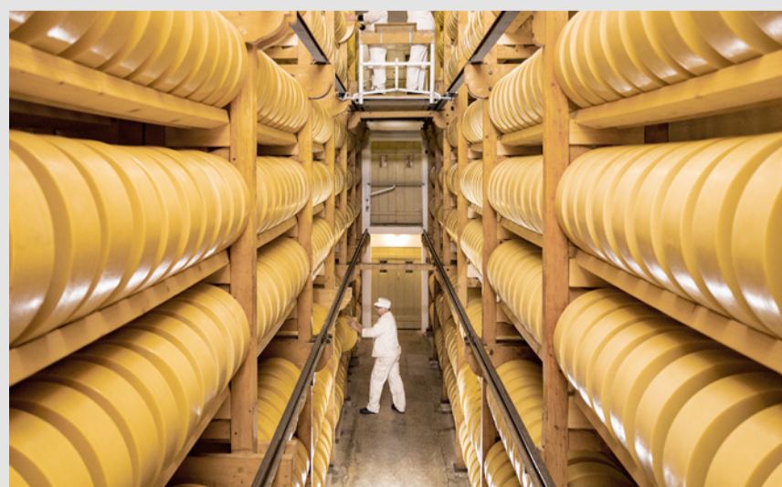
Inmitten von Luzern lagern bis zu 60'000 Laibe des berühmten Sbrinz AOP.

Während einer Führung durch die Reifungskeller erhalten Besuchende spannende Einblicke in die Herkunft, die Produktion und die lange Geschich-