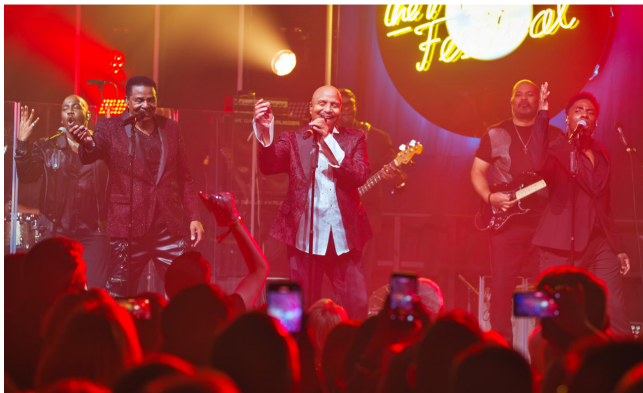
The Jacksons mit Jackie (vorne links) und Marlon Jackson (vorne mittig) am The Retro Festival im vergangenen März.

«Die Liebe zum Detail. Und diese ist im Hotel Schweizerhof Luzern in jedem einzelnen Zimmer aussergewöhnlich. An jedes noch so kleine Detail wurde gedacht. Auch die Mitarbeitenden sind professionell und freundlich.»