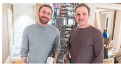
Die beiden Gastwinzer anlässlich ihres Besuchs am 1. April in der VILLA Schweizerhof.

Hinter der «Domaine Bonnet du Fou» verbirgt sich eine ebenso ungewöhnliche wie inspirierende Geschichte. Die beiden Luzerner Freunde wollten ihr Leben nicht als Angestellte verbringen und entschieden sich mutig für einen radikalen Neuanfang am Bielersee. Während Manuel