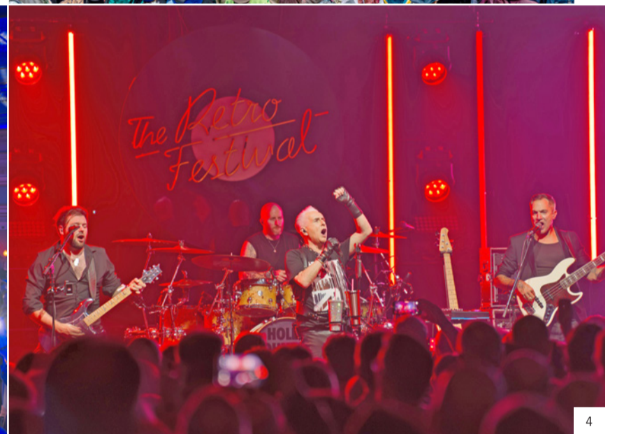
Lilu Lichtfestival Luzern (1) und Schweizerhof Guuggete (2) im Innenhof des Hotel Schweizerhof Luzern. 14. The Retro Festival mit Acts aus den 70er- bis 90er-Jahren im historischen Zeugheersaal (3 & 4).