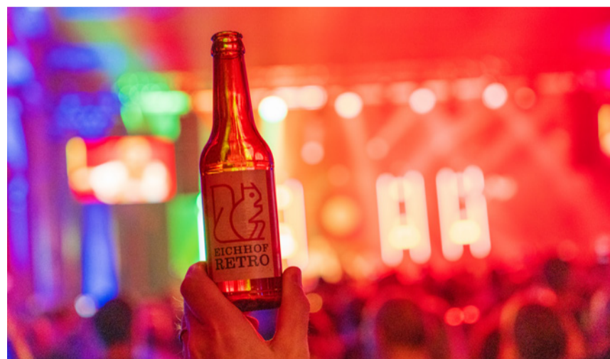
Zum letzten Mal ausgeschrieben anlässlich des The Retro Festival: Das Eichhof Retro-Bier.

(gk) Umberto Tozzi, Starship feat. Mickey Thomas und The Hooters im historischen Zeugheersaal – das The Retro Festival 2017 bleibt vielen Gästen unvergessen. Neben legendären Hits sorgte damals auch eine besondere Premiere für Aufsehen: Die Luzerner Brauerei Eichhof präsentierte erstmals ihr Retro-Bier, das fortan zum festen Bestandteil des Festivals gehörte. Das fruchtige, goldgelbe Bier entwickelte sich rasch zum stimmungsvollen Begleiter für musikalische Zeitreisen durch die 70er-, 80er- und 90er-Jahre.