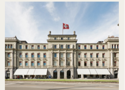
Bundesgericht beim Luzernerhof.

(bk) Wer vom Hotel Schweizerhof Luzern nur wenige Schritte dem Quai entlanggeht, steht bereits vor einem der bedeutendsten Orte der Schweizer Justiz: dem Bundesgericht. Neben dem Hauptsitz in Lausanne ist Luzern der zweite Standort des obersten Gerichts der Schweiz und beherbergt zwei öffentlich-rechtliche Abteilungen. Seit 2002 sind sie im ehemaligen Verwaltungsgebäude der Gotthardbahn direkt am Vierwaldstättersee untergebracht.