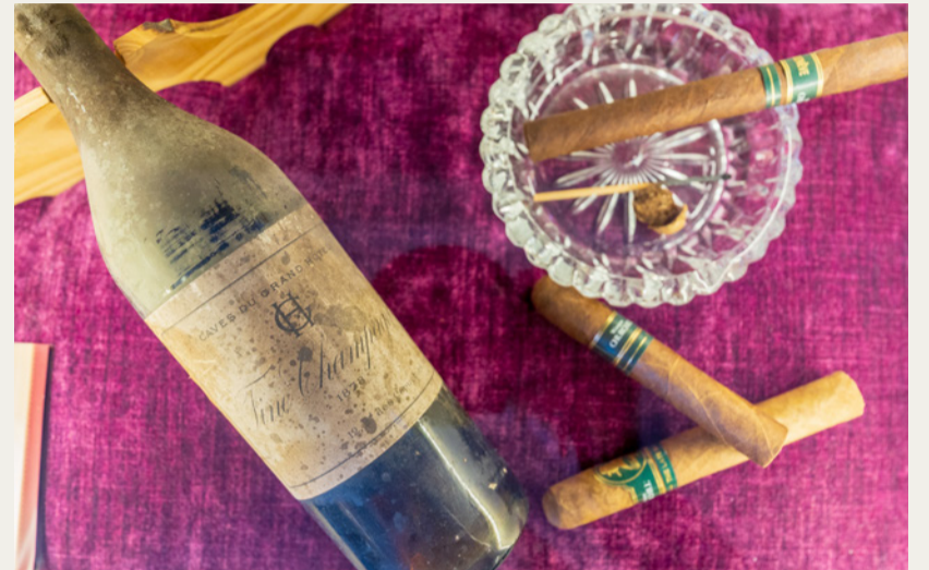
Das Zimmer 185 erinnert an den ehemaligen britischen Premierminister.