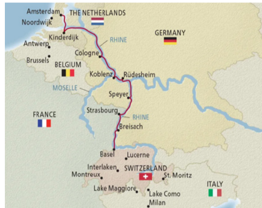
Die Karte zeigt die Zwischenstationen auf der Reise nach Luzern.

So bleibt Luzern, was es immer war: ein Ort der Sehnsucht. Und ist oft jener Zwischenstopp, der länger im Herzen bleibt als geplant.