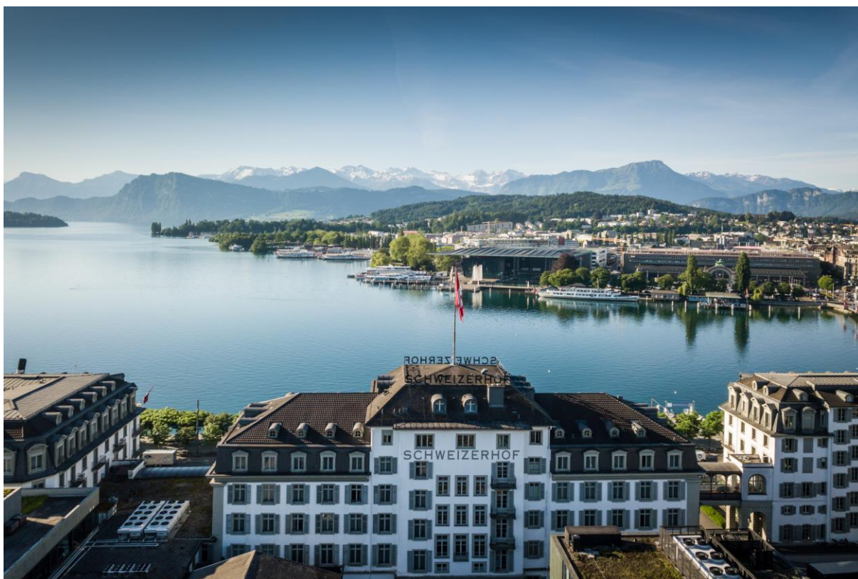
Aussicht auf den Vierwaldstättersee und den Pilatus