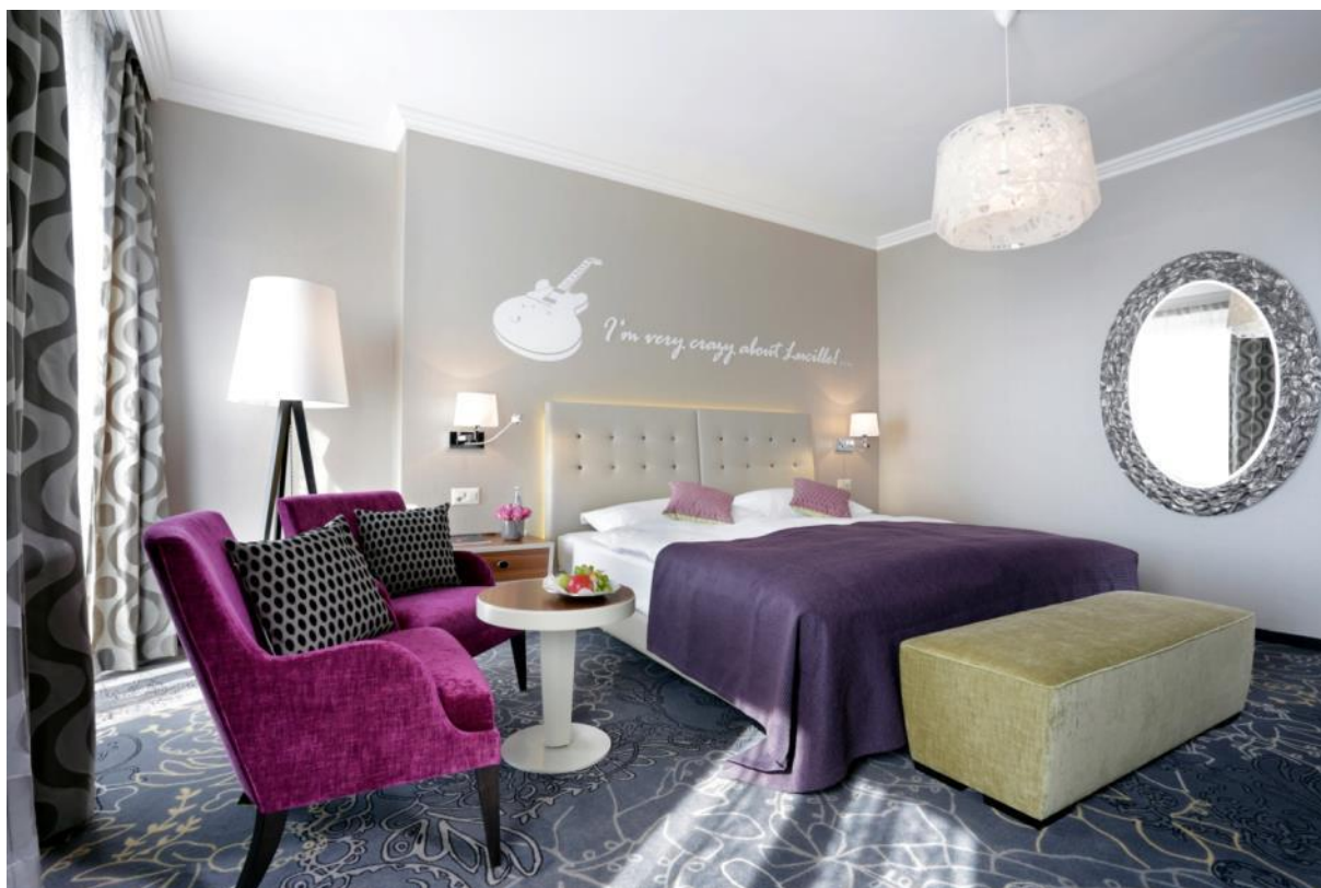
Preisgekröntes Deluxe Doppelzimmer