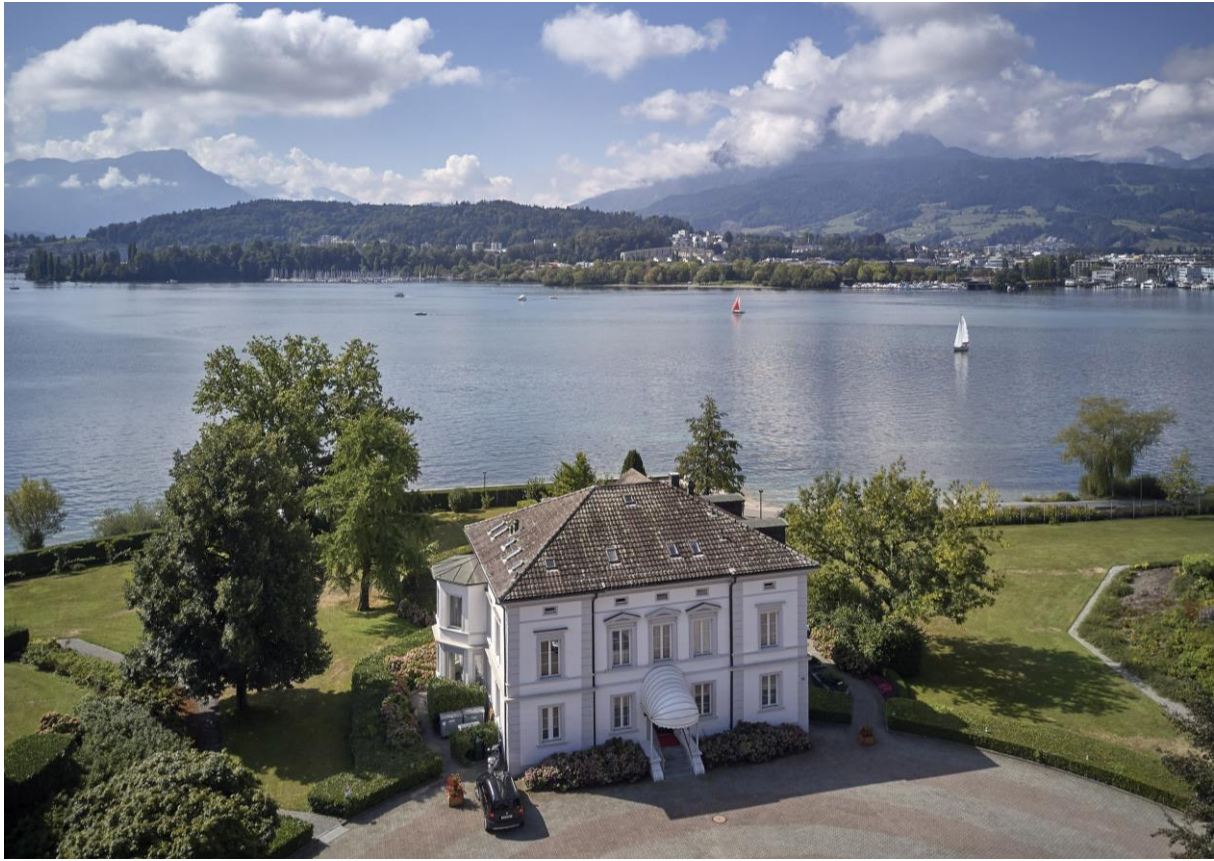
Die VILLA Schweizerhof an unvergleichbarer Lage