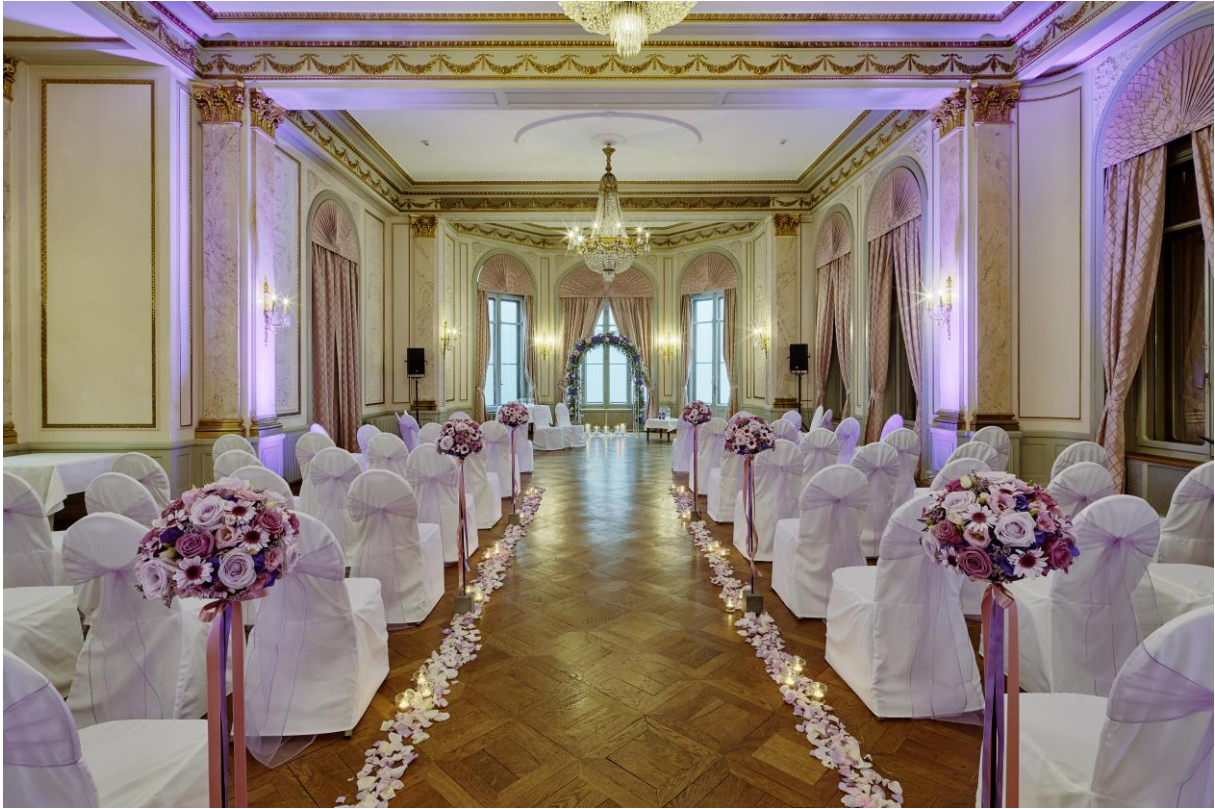
Romantisches Setting für Ihre Trauung