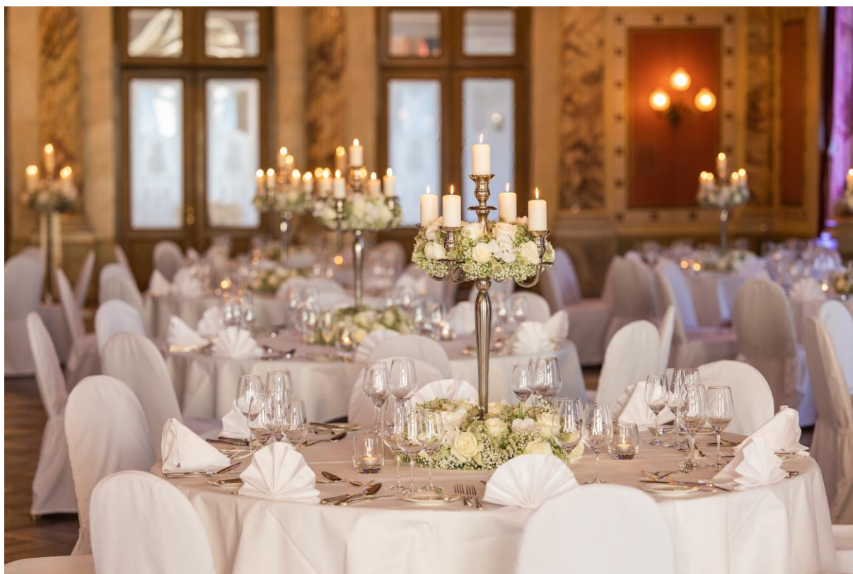
Blumendekoration unserer hauseigenen Floristin