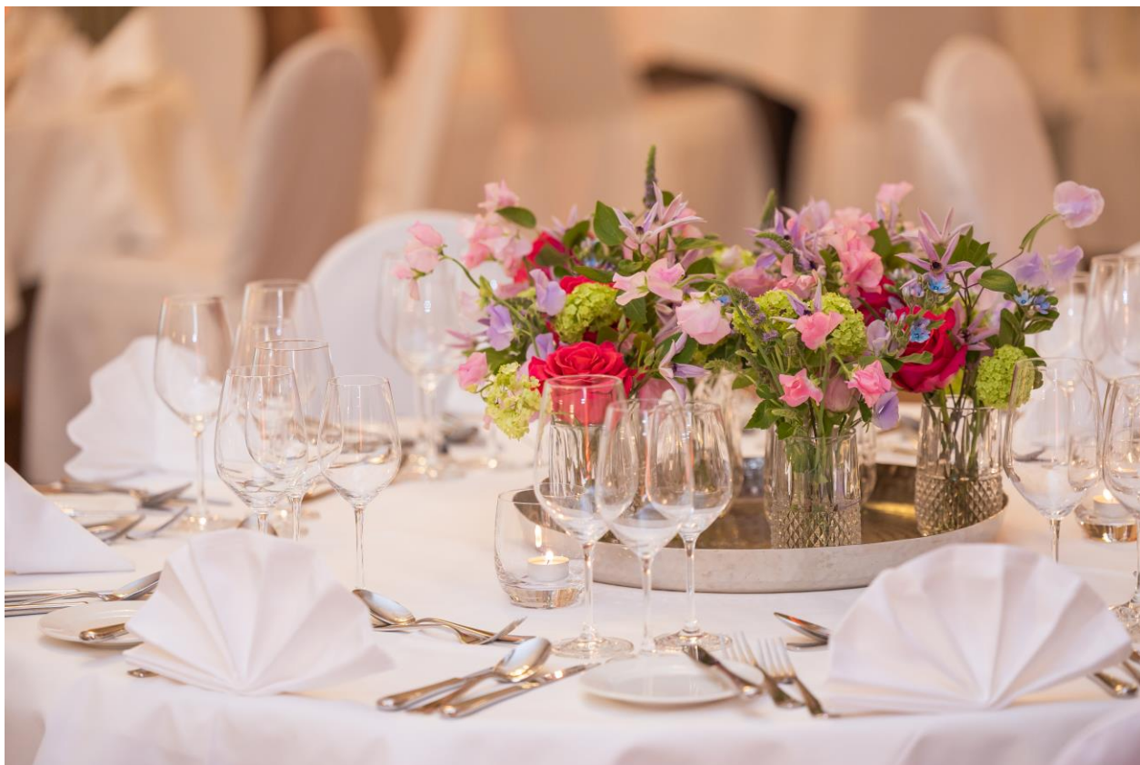
Blumendekoration unserer hauseigenen Floristin