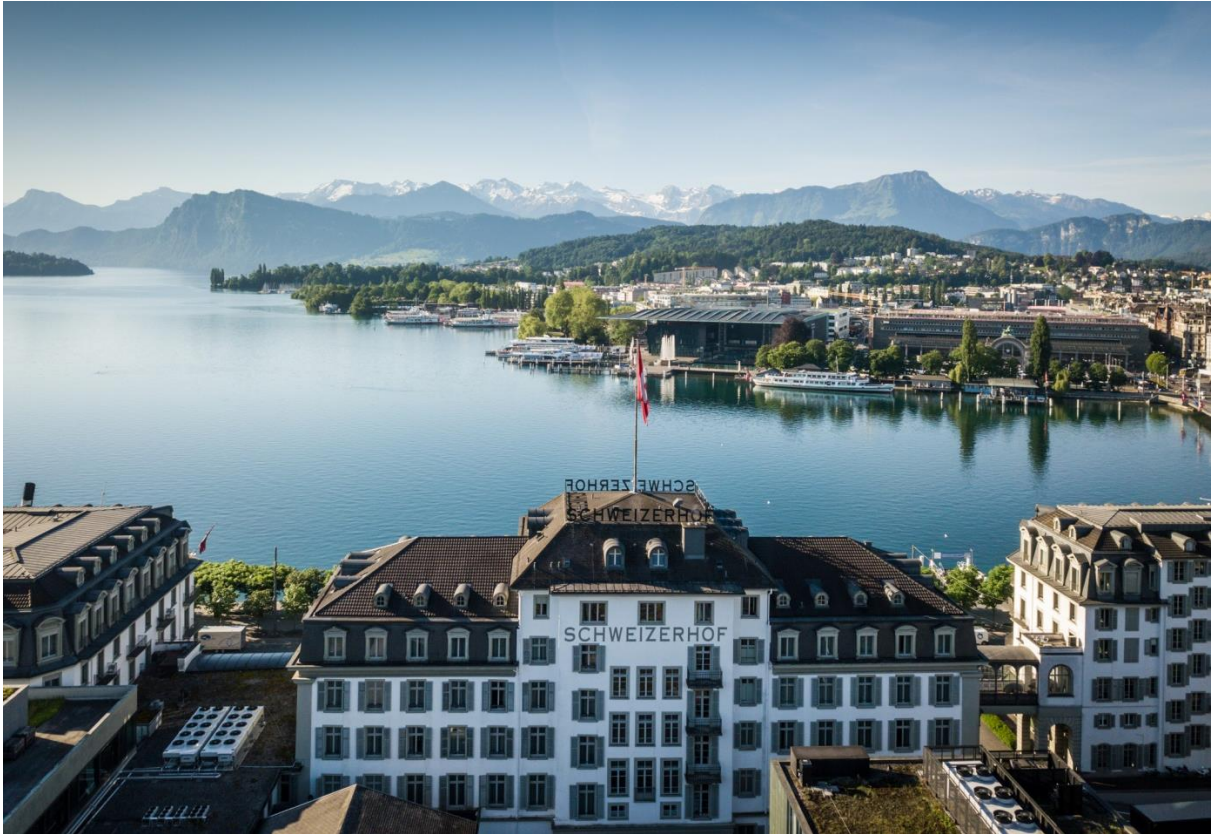
Aussicht auf den Vierwaldstättersee und den Pilatus