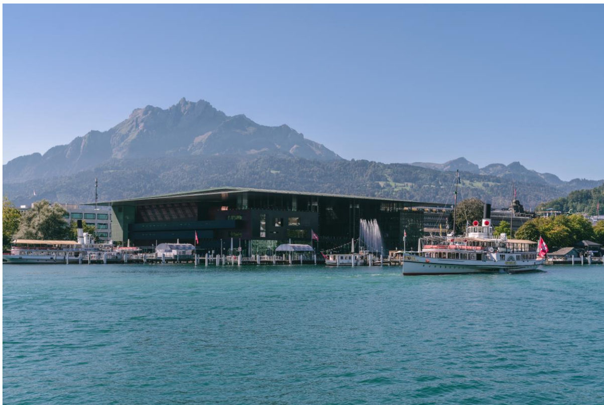
KKL Luzern mit dem Hausberg Pilatus