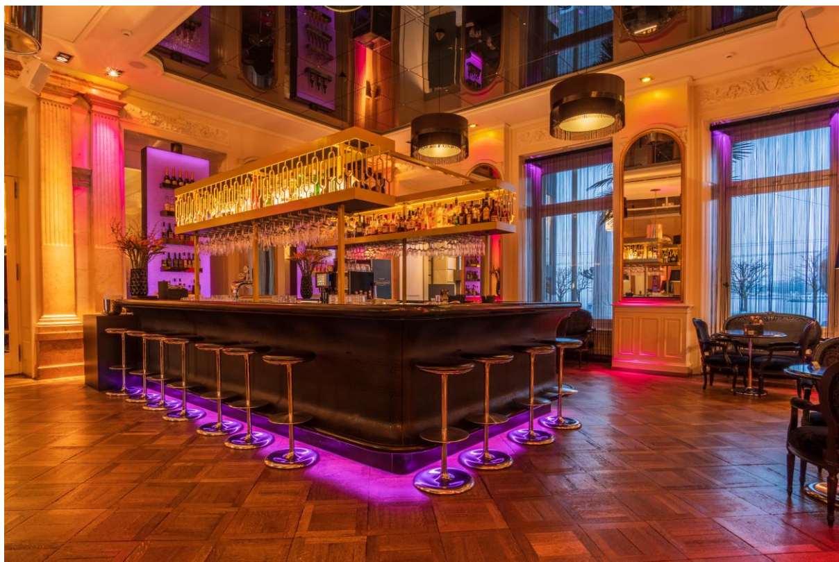
Individuelle Unterhaltung für Ihren Anlass